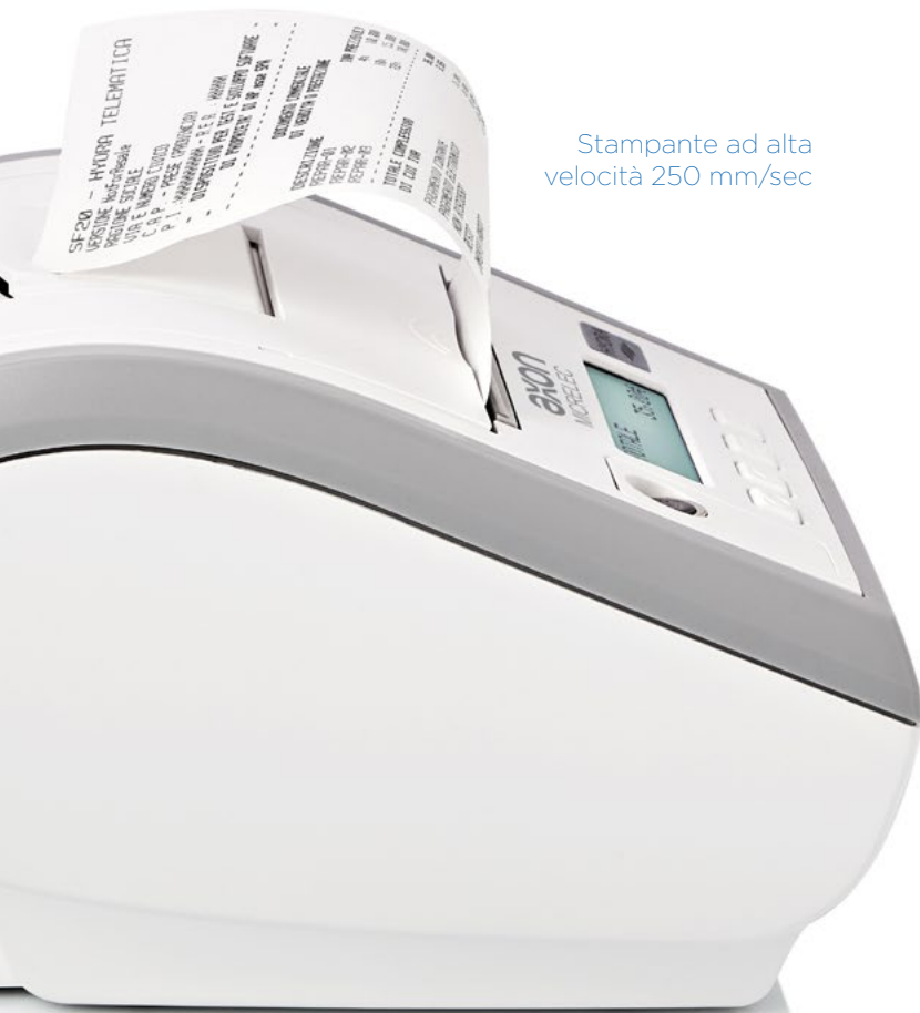
Stampante ad alta velocità 250 mm/sec