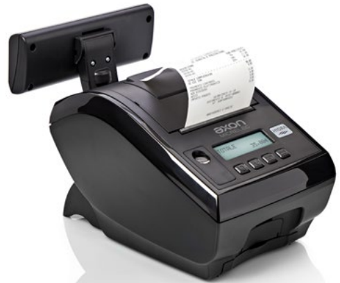
Design elegante e compatto, disponibile in due colori

Il design compatto, le funzionalità avanzate e un set di accessori dedicati consentono di integrare la stampante in qualunque tipologia di punto cassa