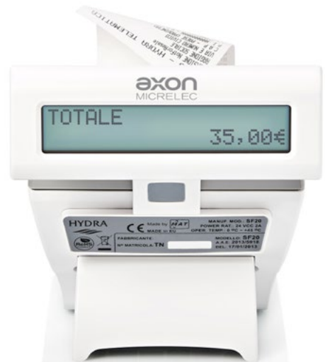
Doppio display ad alta luminosità integrato