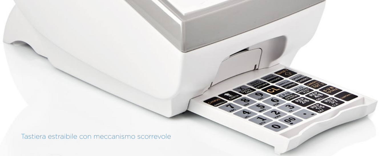
Tastiera estraibile con meccanismo scorrevole