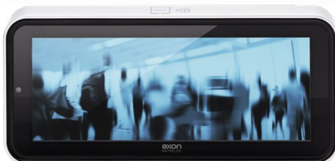
Applicazione a parete